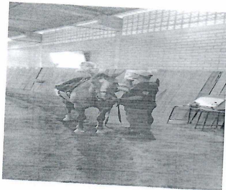
Henrique na sessão de terapia ocupacional e psicologia