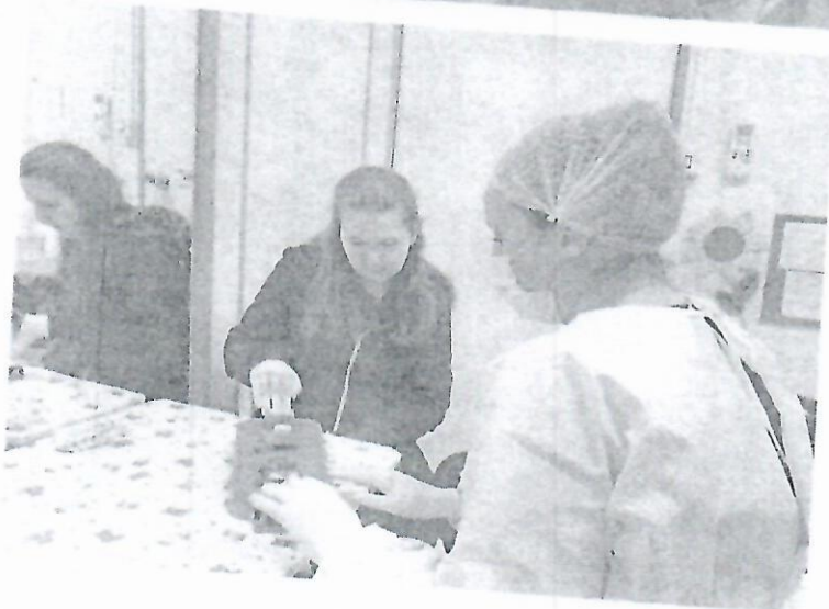
Usuário Valentim em atendimento com a Fonoaudióloga