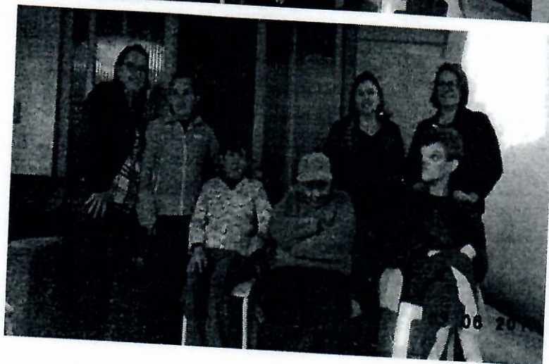
Atividade recreativa e de lazer – usuários realizaram apresentação típica na festa junina da Escola João Theobaldo Magarinos – Bairro Vista Alegre.